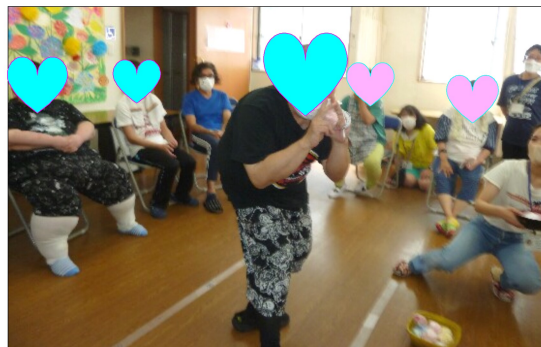
ごろまる きあい い なつかしの五郎丸ポーズで気合を入れて!