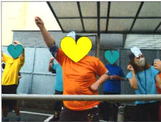
ポーズもバッチリ決まったね!