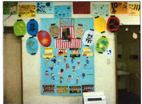
なつまつ 夏祭りへようこそ! へきめんが 壁面画