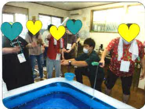
お推しキャラ釣ったよ~ん☆