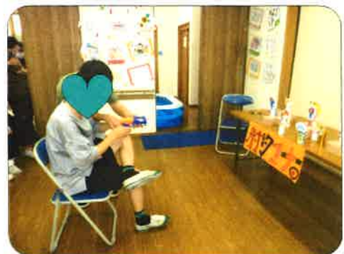
かみ 紙コップ射的の大当たり!