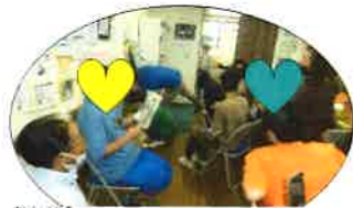
感動のフィナーレは 大東〇〇さんの朗読!

15時からはコロナ以降できなかった保護者と合同の交流会です。可愛いカップケーキと飲み物で打ち上げをしました。久しぶりに会えたので時間が足りないくらいでしたが、どこの机からも賑やかな声が聞こえていました。(上田)