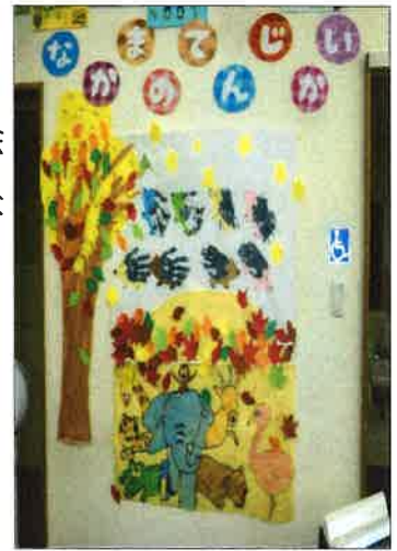
手形を使った合同制作